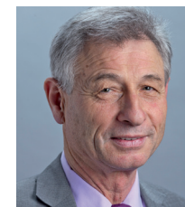
Jean-Pierre Grin Conseiller national / UDC

« Une milice volontaire est une illusion. Le passage à un système volontaire mettrait en danger la sécurité du pays. (...) En supprimant l'obligation de servir, la Suisse devra se doter d'une armée professionnelle qui, entre autres défauts, coûtera beaucoup plus cher que notre système actuel. »