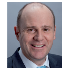
Thomas Hurter Nationalrat / SVP

« Unsere Armee steht für Sicherheit und Stabilität; wir sprechen da von einer Landesversicherung. Unsere Armee leistet Hilfe und unterstützt die Bevölkerung; da sprechen wir von der Truppe der ersten Stunde. Selbstverständlich ist die Armee auch für die Landesverteidigung und Friedensförderung da. »