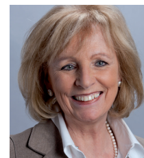
Ursula Haller Vannini Nationalrätin / BDP

« Unsere Bevölkerung wünscht sich eine Armee, die dank der Spezialisierung vielseitig verfügbar ist, mit einer gut ausgebildeten Mannschaft, die technisch auf dem aktuellsten Stand ist. »