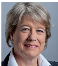
Corina Eichenberger-Walther Nationalrätin / FDP

« Das gegenwärtige System ermöglicht massgeschneiderte und damit auch wirtschaftsverträgliche Aufgebote, im «worst case» hunderttausend Armeeangehörige (...). Das System spart Geld, indem es das Potenzial der zivilen Kenntnisse und Fertigkeiten ausnützt. »